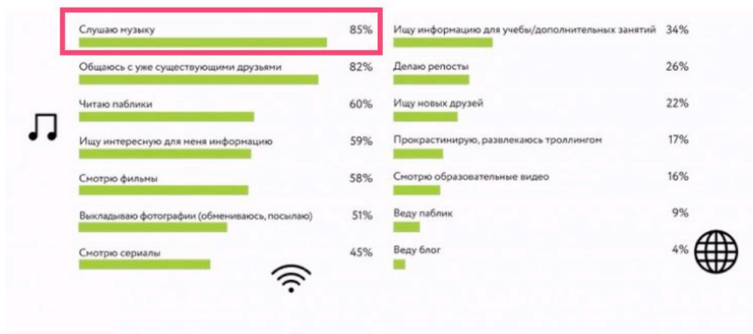
Диаграмма 1. Показатели активностей подростков в социальных сетях