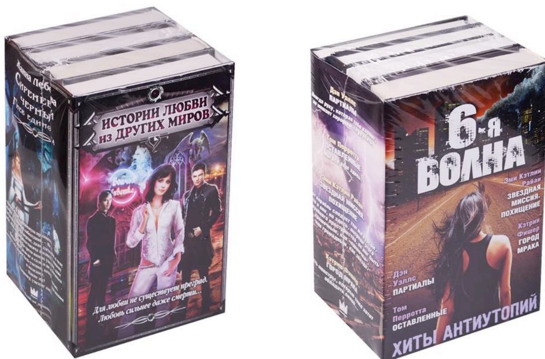
Фотография 1. Комплекты книг издательства «АСТ»