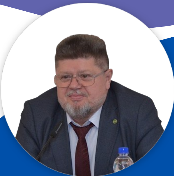
Евгений Брюн , д.м.н., профессор, главный внештатный психиатр-нарколог Минздрава России, президент ГБУЗ «Московский научно-практический центр наркологии» Департамента здравоохранения г. Москвы