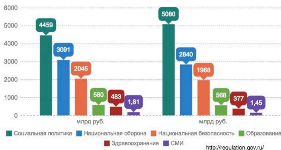
Расходы федерального бюджета на 2016 и на 2017 гг.

В рамках оптимизации расходов федерального бюджета предполагается и сокращение на 6-20% выделяемых средств на СМИ. Что это может означать, рассуждают эксперты.