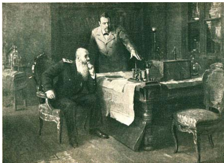
А. С. Попов демонстрирует адмиралу С. О. Макарову свою первую радиостанцию. 1900 г. 10

Командующий Балтийским флотом адмирал С. О. Макаров высоко ценил деятельность ученого и ходатайствовал о его награждении за создание системы телеграфа без проводов для Военно-морского флота России.