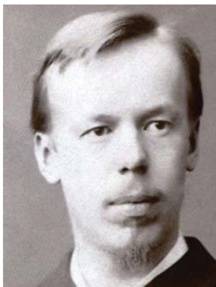
Студент физико-математического факультета Петербургского университета Александр Попов. 1882 г. 1

В 1882 г. он успешно окончил университет со степенью кандидата, защитил диссертацию на тему «О принципах магнито- и динамоэлектрических машин постоянного тока» и получил приглашение остаться на кафедре физики для подготовки к профессорской деятельности. Однако молодого ученого больше привлекали экспериментальные исследования в области электричества, электромагнитных волн и их практического применения.