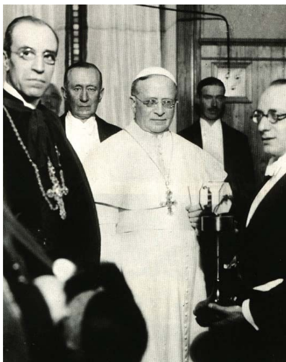
Ватикан. 12 февраля 1931 г. Торжественное открытие радиостанции. На снимке: в центре папа Пий XI, на втором плане слева Г. Маркони 5

12 октября того же года было связано с еще одним знаменательным событием, произошедшим в Бразилии, но ставшим символическим для всего христианского мира. Речь идет о торжественной церемонии открытия и освящения статуи Христа-Искупителя, простершего руки над Рио-де-Жанейро. Г. Маркони был удостоен чести послать из Ватикана радиосигнал, с помощью которого монумент был подсвечен прожекторами и лампочками, что произвело незабываемое впечатление на присутствовавших. Со временем из-за технических проблем при передаче сигнала на расстояние более 9 тыс. км управление электроосвещением